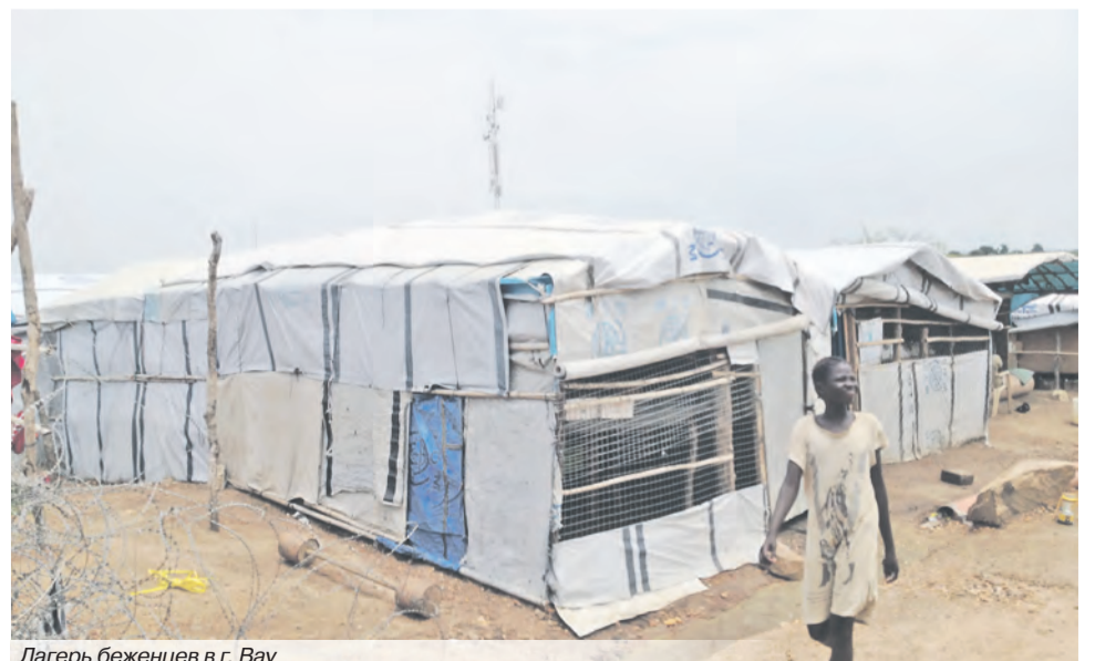
Лагерь беженцев в г. Вау