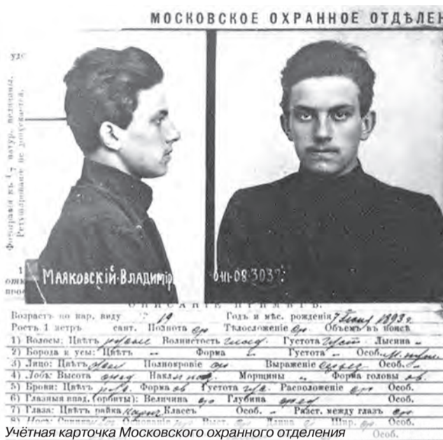
Учётная карточка Московского охранного отделения