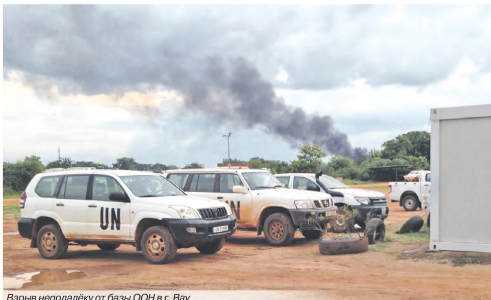
Взрыв неподалёку от базы ООН в г. Вау

Юлия ФРОЛОВА Республика Хакасия